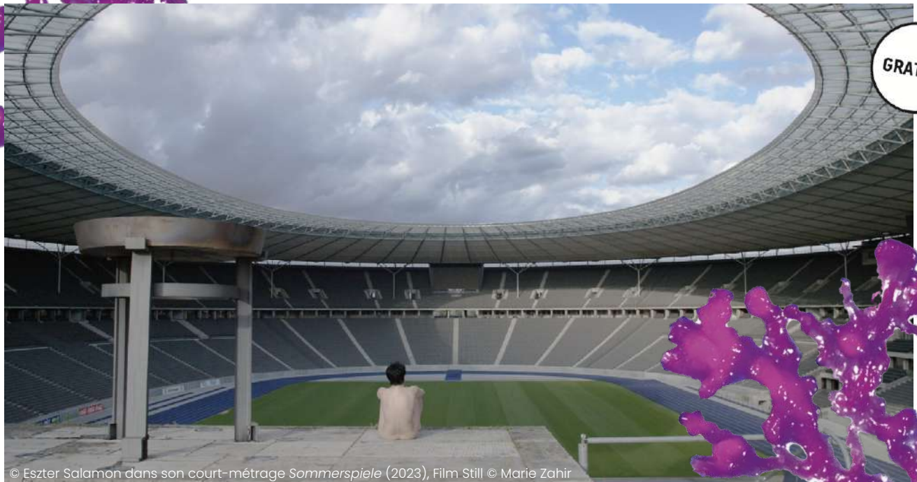
© Eszter Salamon dans son court-métrage Sommerspiele (2023), Film Still © Marie Zahir

13 juin | 20h45 Maison Folie Wazemmes, Lille Gratuit sur réservation