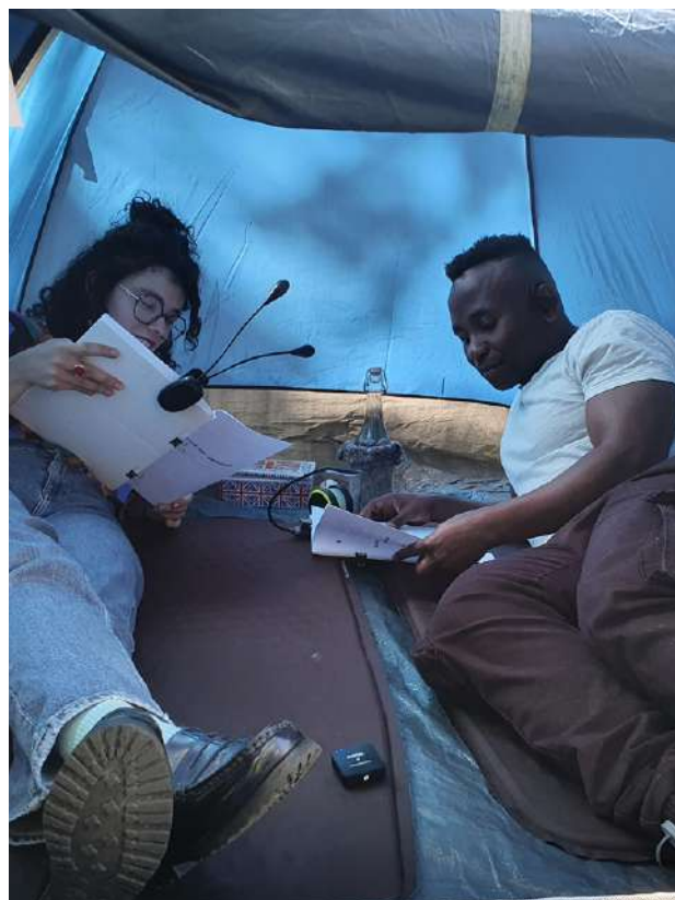
Hors-Champ, Ivana Müller